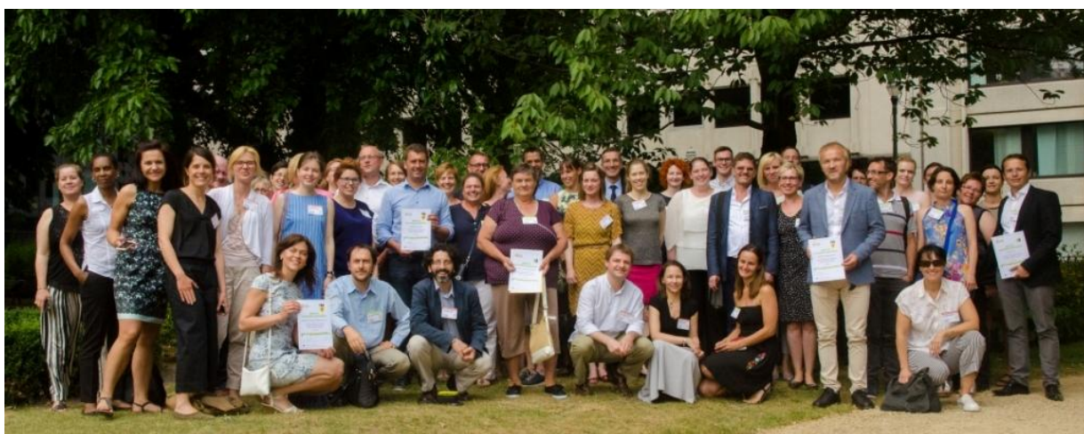
A Spórolunk@kiloWattal konzorcium a résztvevő országok nyertes csapataival a Díjkiosztó Ünneppel egybekötött projektzáró találkozón Brüsszelben

https://sporolunk.org/images/partner/GDI-files/sw_D6.5_EvaluationReport_FULL_Sept2017.pdf